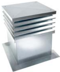
mögliche bauseitige Wetterschutzhaube bei Einbau im Dach (4-seitig geöffnet)